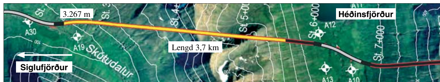
Staða framkvæmda við Héðinsfjarðargöng 28. jan. 2008. Búið er að sprengja 3.267 m í Siglufirði og 2.380 m í Ólafsfirði.

Gröftur Héðinsfjarðarganga frá Ólafsfirði gekk mjög vel í viku 4 og þar voru sprengdir 94 m sem eru mestu afköst í verkinu til þessa. Lengd ganga þeim megin frá er nú 2.380 m. Gröftur frá Siglufirði gekk hins vegar mun hægar í vikunni í erfiðu bergi auk þess sem unnið var við bergþéttingar. Þar voru sprengdir um 31 m og er lengd ganga þeim megin frá um 3.267 m. Samtals er því búið að sprengja um 5.647 m eða um 53,4% af heildarlengd.