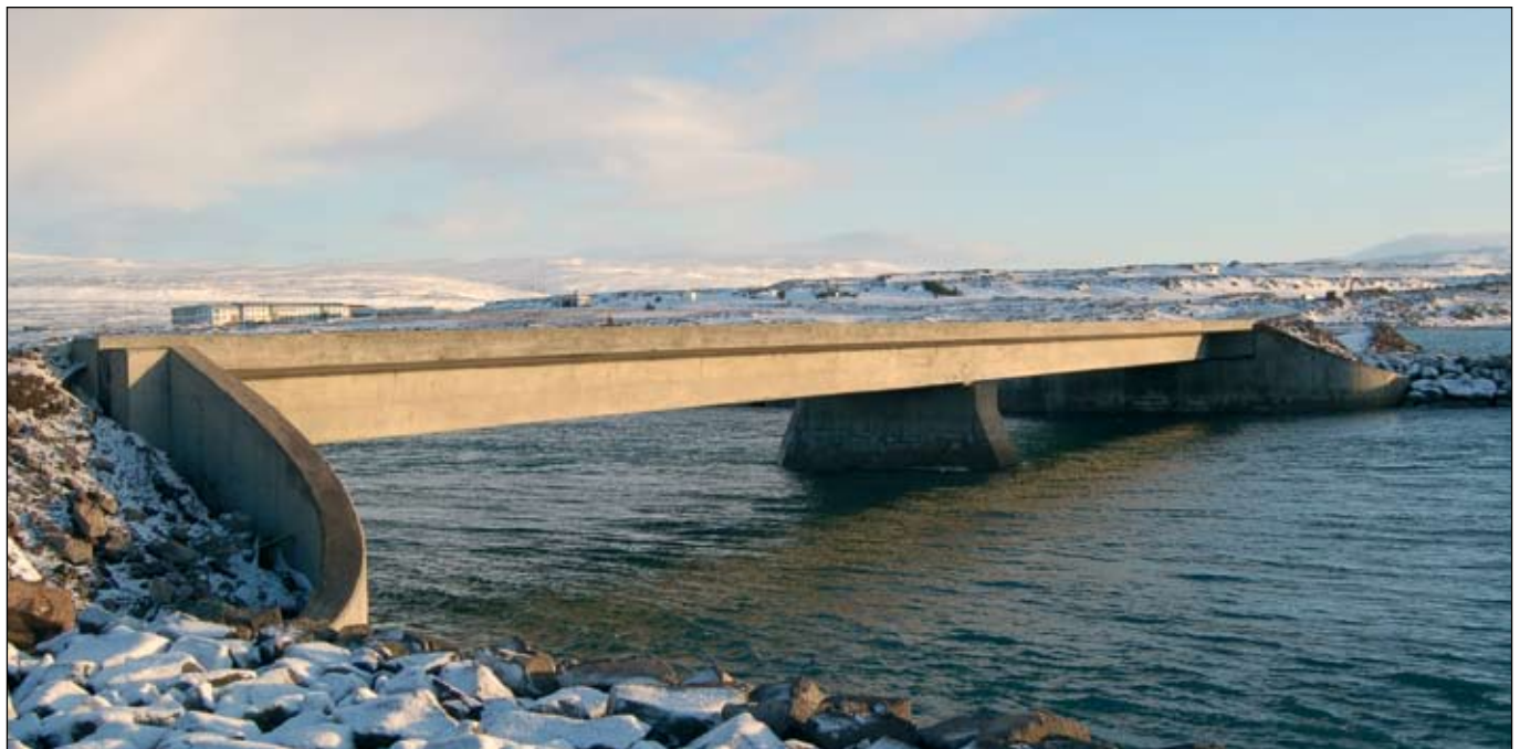
Framkvæmdir í Reykjafirði við Ísafjarðardjúp. Skólahús á Reykjanesi sjást í baksýn.