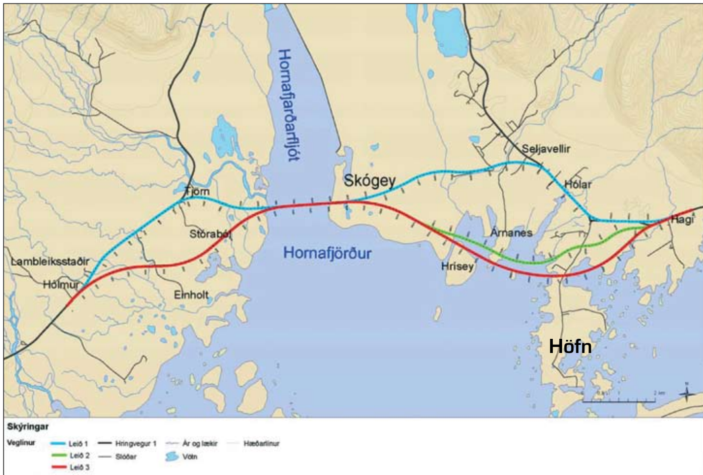
Veglínur sem lagðar eru fram í mati á umhverfisáhrifum.

unni og ýmsar leiðir hafa verið skoðaðar. Ljóst er að á þessum stað er möguleiki á að stytta Hringveginn umtalsvert með því að færa hann sunnar. Þær leiðir sem hér eru kynntar eru afrakstur af samstarfi Vegagerðarinnar og sveitarfélagsins Hornafjarðar. Staðsetning vegarins afmarkast m.a. af legu flugvallar þar sem nýr vegur verður að liggja í ákveðinni fjarlægð frá flugvelli, annað hvort norðan eða sunnan við flugvöll Veglína milli Laxár og flugvallar kemur ekki til greina miðað við kröfur flugmálastjórnar.