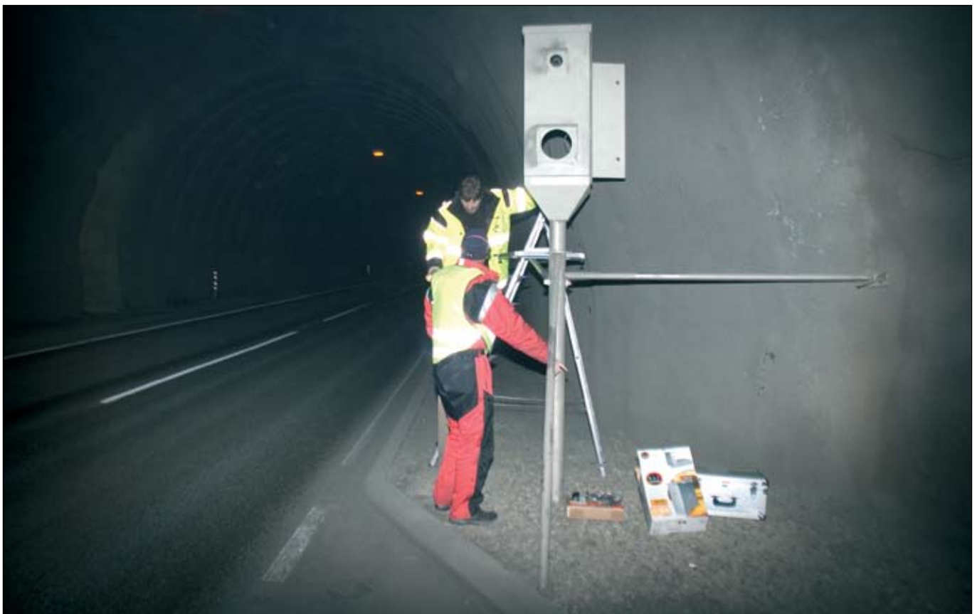
Uppsetning hraðamyndavéla í Fáskrúðsfjarðargöngum.

Rituð var grein sem birt var á ráðstefnu „First North American Landslide Conference“, sem haldin var í júní 2007. Hún tengist verkefninu „Innri gerð berghlaups í Tjarnardölum“, sem var framhald verkefnis um kortlagningu á sigi á Siglufjarðarvegi um Almenninga (í utanverðum Skagafirði). Athuganir benda til að landið skríði þarna fram um tæpa 70 cm á ári. Talið er að landið skríði að mestu fram á setlögum, hvatt áfram af grunnvatni sem lekur gegnum grófari hluta efnisins, enda færslan mest við snjóbráðnun á vorin og í haustrigningum.